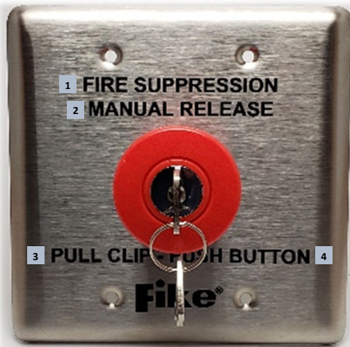
1. Supresión de incendios 2. Liberación manual 3. Tira el clip. 4. Oprima el botón