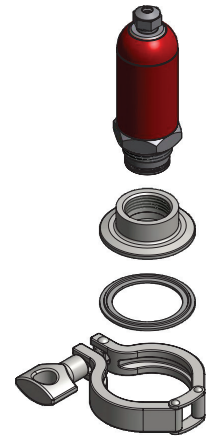
固定型安装备件 探测器需单独订购

注释: 对于特殊的应用, 光纤光电电缆可作为可选附件。 有关详情, 请参考数据表 X.4.47.17ZH。